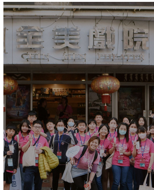
府城台南篇 Tainan Downtown