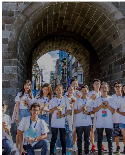
復古台北篇 Taipei Golden Age